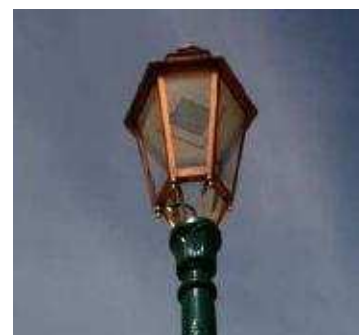
Intégration possible Respectant le style De chaque lanterne